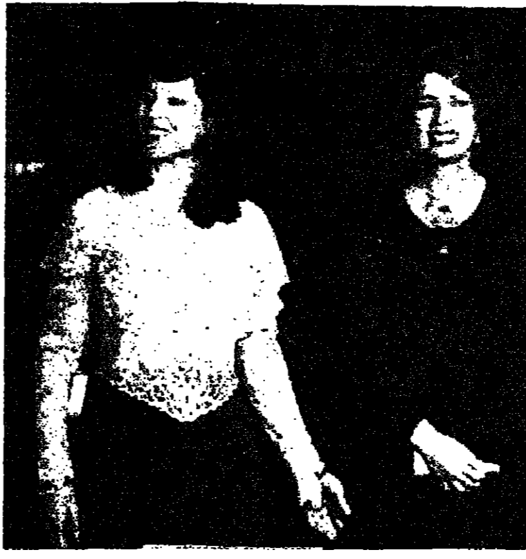
سيدة مصر الاولى جيهان السادات والسيدة اوفيرا نافون اثناء حفلة العشاء التي اقامها الرئيس المصري في قصر عابدين ليلة الاثنين تكريماً للرئيس نافون وعقبيلته.

لوتو - في تصويب نتائجها في سحب اللوتو في 20 ايلول 1980 (10000000 ليرة) في شروق راسد!!